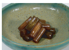
行者にんにくの醤油漬け